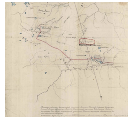
Рисунок 2 – Схематическая карта Семипалатинской области 1890 г. [16]

Аналогичное по значимости место расположено в верховьях реки Шидерты в нынешней Карагандинской области. Там Олжабай возглавил огромное войско, чтобы разгромить вторгшихся на их землю маньчжур, которых казахи называли шуршытами. С тех пор эта местность носит название Шуршыткырган. Данное место сражение зафиксировано схематической карте 1890 года.