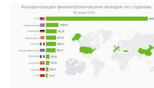
Сурет 1 – https://psylib.org/filantrop/ автор: Каролина Кораблёва

Салыстыру үшін, Америка Құрама Штаттарында американдықтардың шамамен 90 % қайырымдылықпен айналысады, ал қайырымдылыққа аударылған қайырымдылық көлемі үнемі елдің ЖІӨ-нің 2 % асады.