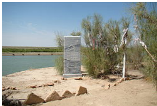
Сурет 1 – Сырдария өзенінің жағасында Қорқыт қабірінің орнына орнатылған Стелла.

альбомы» жинағында жарияланған фотосуреттер бізге жетті. Диваев пен Кастаньенің зерттеулерінде, құрылым шикі кірпіштен жасалған дөңгелек пішінді 6-8 қырлы күмбезді құрылым. Қабырғалары қарама-қарсы өрнекпен ойылған. Исламға дейінгі түрік сәулетінің үлгісінде салынған.